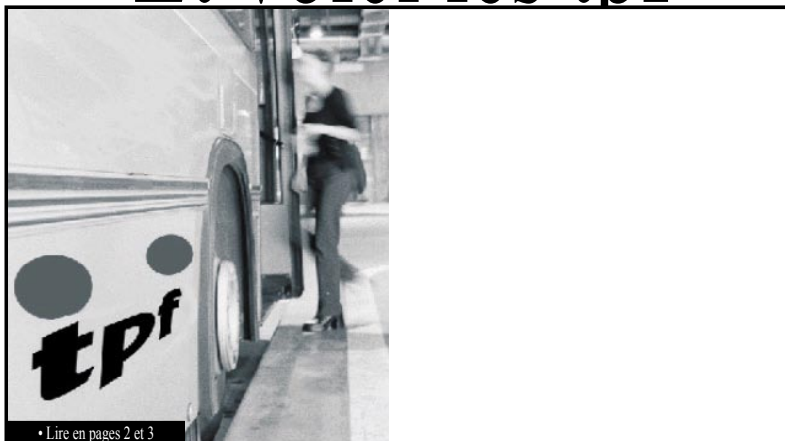
• Lire en pages 2 et 3