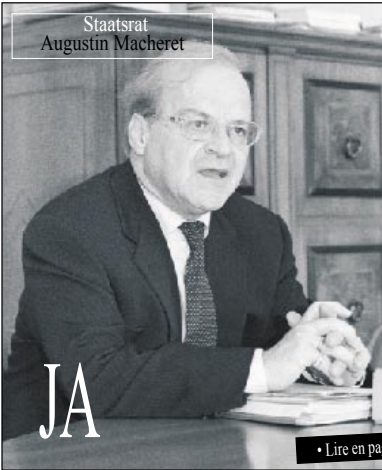
Staatsrat Augustin Macheret

L'homme a autant de peurs que la femme. A un détail près : il cache ses craintes. Le jeune garçon est souvent conditionné à ne pas montrer ouvertement ses peurs.