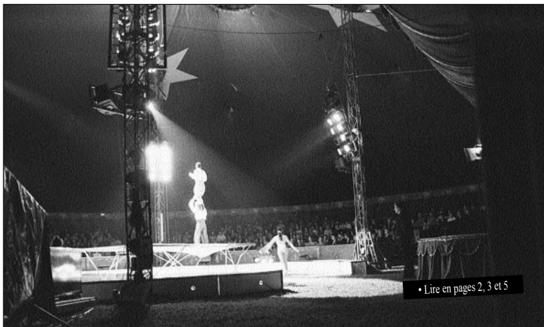
• Lire en pages 2, 3 et 5